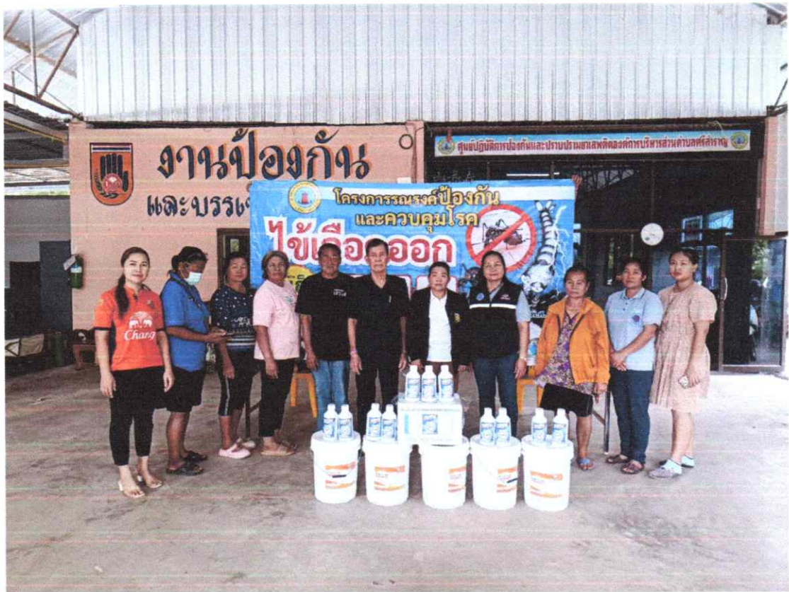
ภาพประกอบโครงการป้องกันและควบคุมโรคไข้เลือดออก ประจำปีงบประมาณ ๒๕๖๗